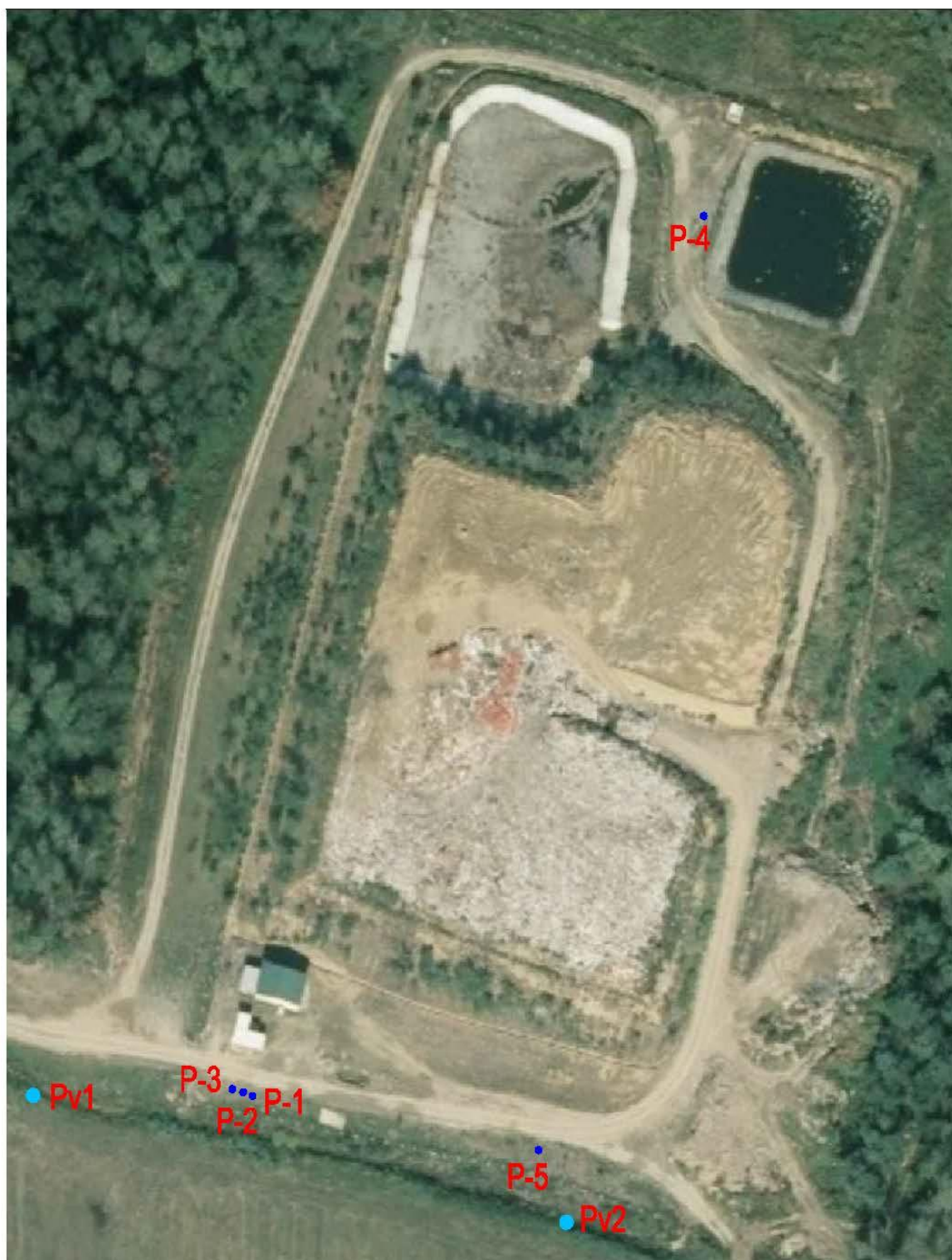
Prilog 2. Orto-foto karta s prikazom mjesta uzorkovanja voda

Legenda: P1-P5 = Pijezometri Pv1-Pv2 = Praćenje stanja površinskih voda